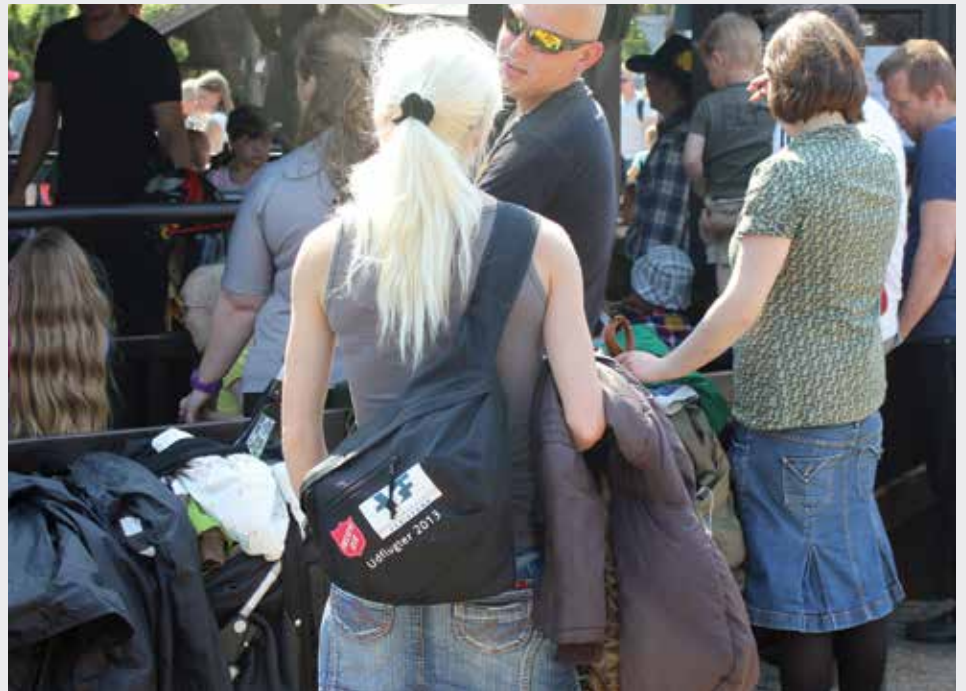
Når lønmodtagere glemmer at hæve deres optjente feriepenge, går pengene i Arbejdsmarkedets Feriefond, der donerer dem videre til gavn for vanskeligt stillede.

Udflugterne går til destinationer som Legoland, Fårup Sommerland, Bon Bon Land og Jobo Land, udflugtsmål, som