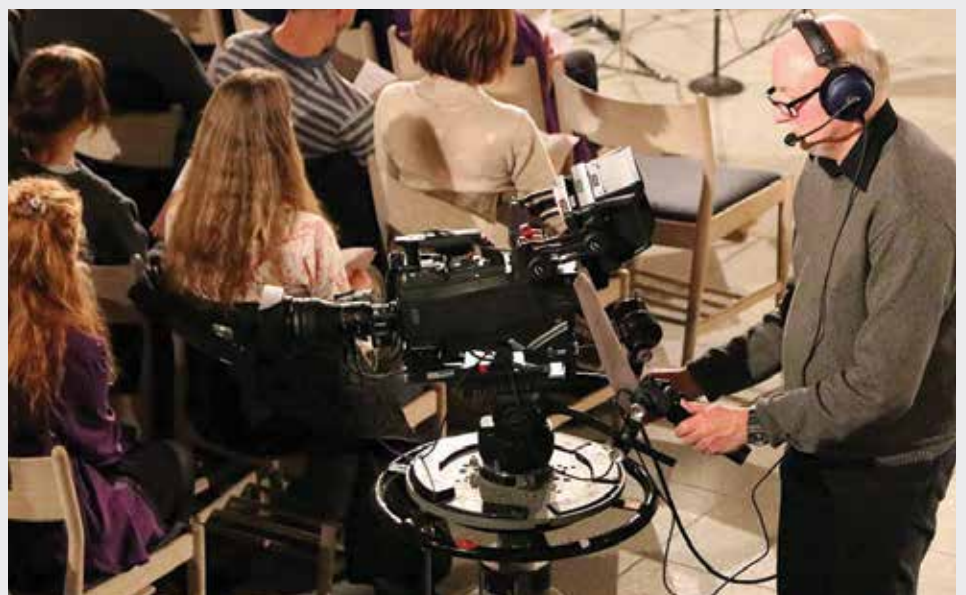
Frelsens Hær kan søndag den 25. maj klokken 14.00 opleves i DR Kirken på DR K. Anledningen er Baptistkirkens 175-års jubilæum i Danmark, der bliver fejret som et fælles frikirkejubilæum.

Det er første gang DR Kirken sender gudstjenester fra frikirker. Foruden Frelsens Hær bringes også gudstjenester fra Baptistkirken og Pinsekirken.