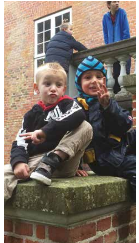
I Nakskov er et øget fokus på børn og unge en naturlig udvikling i familierarbejdet.

Frelsens Hær i Nakskov har to familieværksteder - et for familier og et for enlige forsørgere. I det sidstnævnte er enlige fædre også velkomne. Her et glimt fra en familielejr i efteråret.