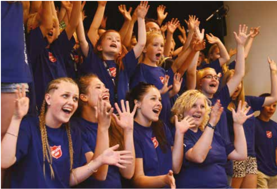
Der er blevet flere børn og unge i Frelsens Hær efter en målrettet indsats.