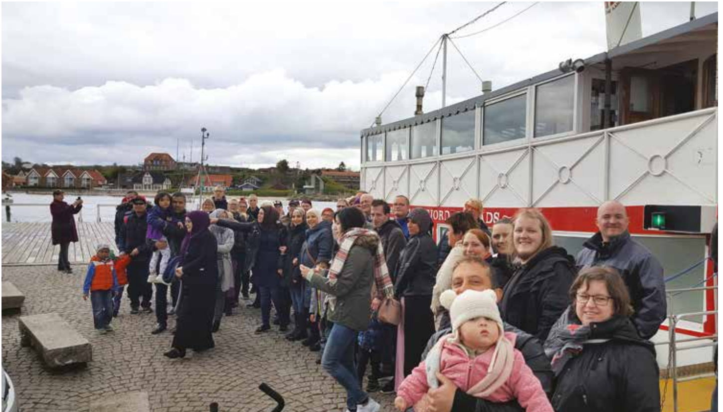
Som et særligt tilbud inviterede Sønderborg Kommune 60 børn og voksne fra Hærens familiearbejde på udflugt med en hjuldamper på Als Sund.