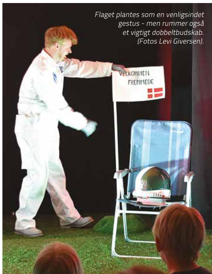
Flaget plantes som en venligsindet gestus - men rummer også et vigtigt dobbeltbudskab.

For mange udsatte familier opleves kulturtilbud som et fjernt, uopnåeligt univers. Derfor var temaet for årets Aprilfestival i Sønderborg, Naboskab - og derfor samarbejder kommunen med Frelsens Hær om at bringe kulturen ud til folket.