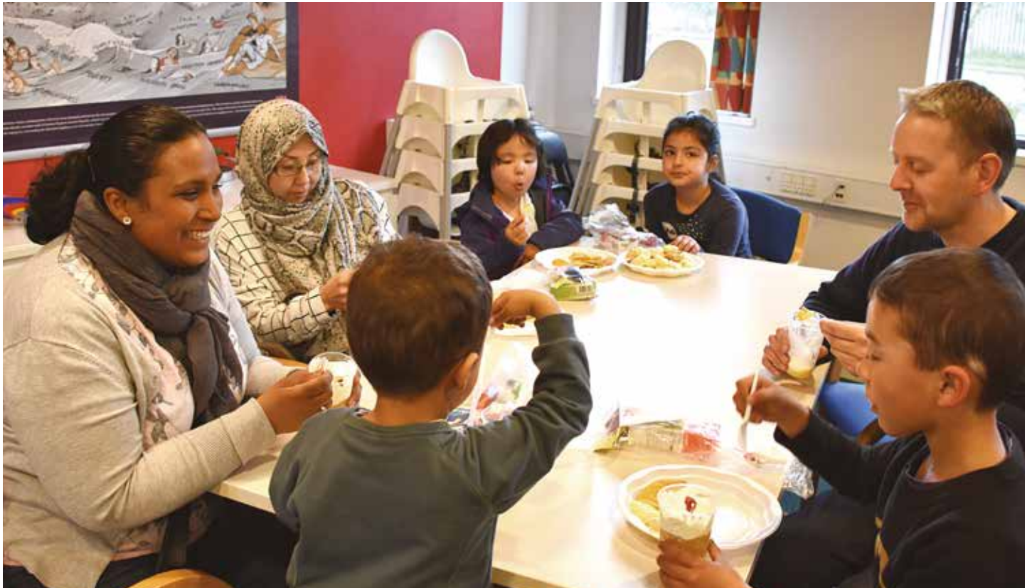
Efter teaterforestillingen var Frelsens Hær i Sønderborg vært med et let traktement, som mange tog del i.