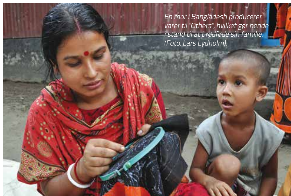
En mor i Bangladesh producerer varer til "Others", hvilket gør hende i stand til at brødføde sin familie.

I Danmark indgår Frelsens Hær blandt andet via sin indsats for udenlandske hjemløse i et løbende samarbejde med Center Mod Menneskehandel.