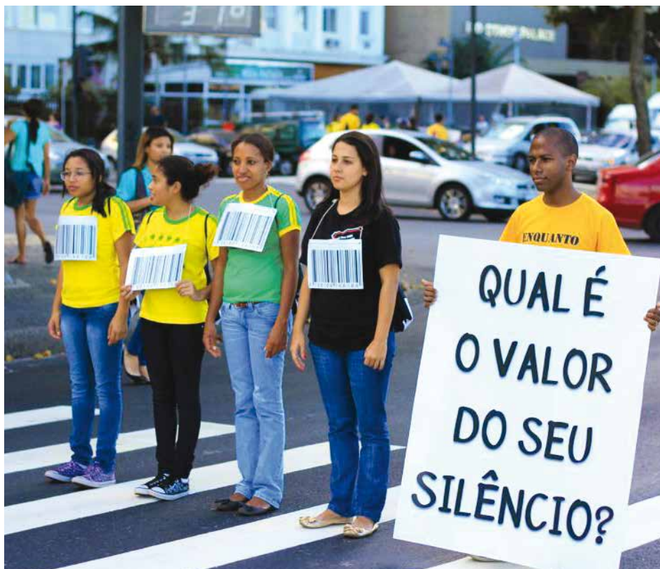
"Hvad er prisen på din tavshed?", spørger medlemmer af Frelsens Hær på gaden i Brasilien.

FN anslår, at der findes 2,5 mio. ofre for menneskehandel i verden. Heraf kommer størstedelen fra Asien og Stillehavsområdet.